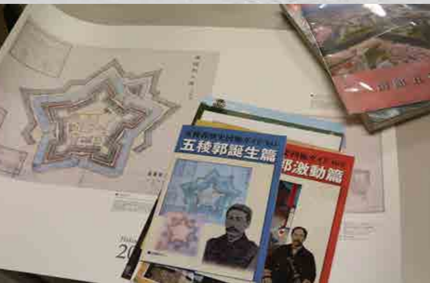
個人ブログ: 解釈の迷宮～歴史学とかあれやこれや～ https://blogs.yahoo.co.jp/historian126 現存十二天守完全制覇計画。 https://blogs.yahoo.co.jp/historian126/53824074.html

佐伯先生は個人のブログで天守巡りについて書いていらっしゃる、現在は12個中11個巡り終えているという。