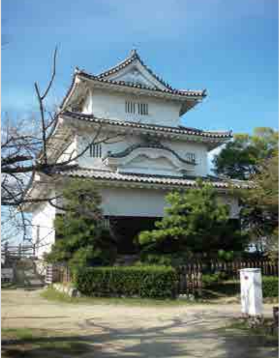
丸亀城 (香川県丸亀市)

「1番好きなお城は香川県の丸亀城です。丸亀城は石垣の高さが60mもあって1番高いけれど天守の大きさは12個中下から3番目です。小さい。そのバランスの悪さが個性になっていて、私はマツチヨな体の上にイケメンが乗っている感じと表現しています(笑)」