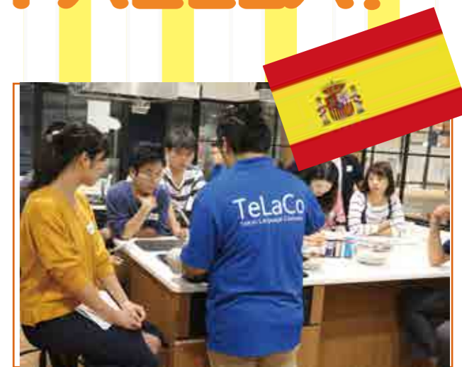
▷パエリアの完成を待つ学生

TeLaCoで行っているクッキングイベント! 今回のテーマはスペインでした! 10分ほどで完成し、参加者とTeLaCoを昼休みに利用している学生で試食! みなさんあっという間に完食していました!