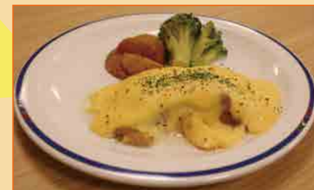
日替わりメニューは毎日楽しみ