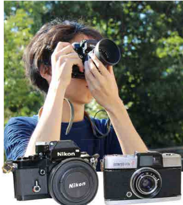
Nikon F2 フォトミック(一眼レフ) 内蔵されたミラーによって、ファインダーで見た画像がそのまま写る。電池を入れると露出計が使える。