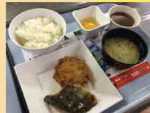
朝は100円朝食が 大人気!