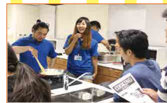
▷TeLaCoのスタッフの方と楽しく会話をしている学生

イベントスタッフの方のコメント クッキングイベントは月に2回行っています。 英語が得意、不得意に関わらず気軽に参加してみてください! 事前に申し込みが必要ですが、参加料は無料です。