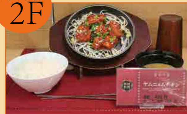
ヤムニョムチキン490円

蔦友館2階の利用者は、お昼休みの時間だけでなんと 600~700人!たくさんの方が利用しています!