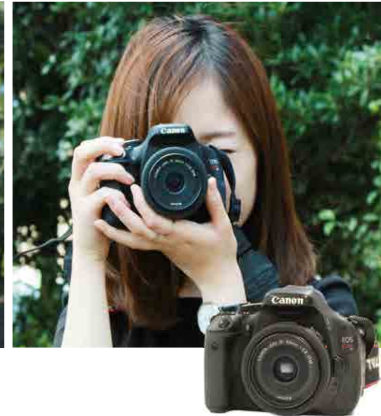
Canon EOS kissx5(一眼レフ) 望遠レンズなどと組み合わせても使える、初心者にも扱いやすい。