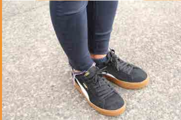
金谷 彩香 (18) 埼玉県出身 経済学部 経済学科 1年