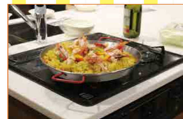
▷完成したパエリア

TeLaCoで行っているクッキングイベント! 今回のテーマはスペインでした! 10分ほどで完成し、参加者とTeLaCoを昼休みに利用している学生で試食! みなさんあっという間に完食していました!